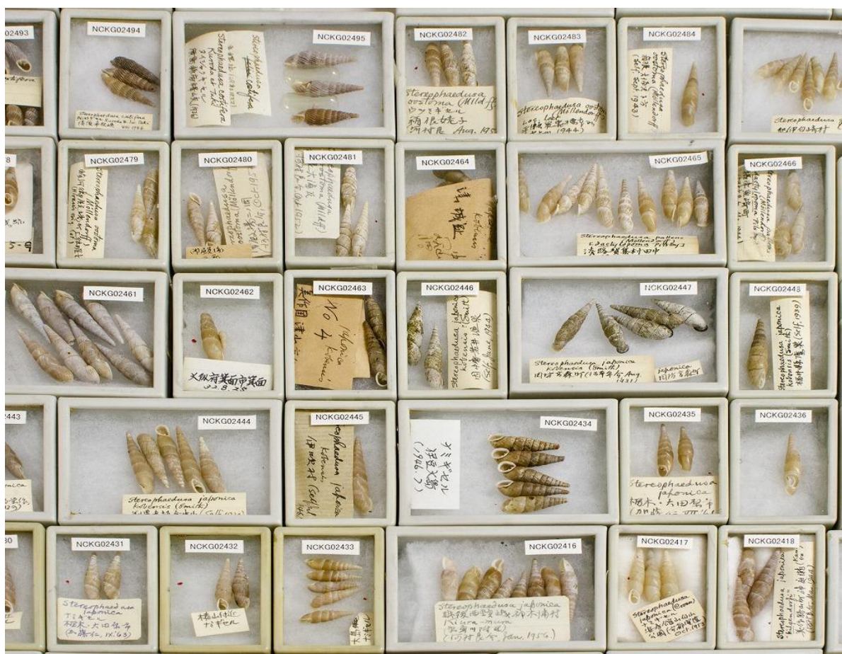
写真1: キセルガイ科の標本 (黒田コレクションより) 所蔵: 西宮市貝類館、撮影: 佐治康生