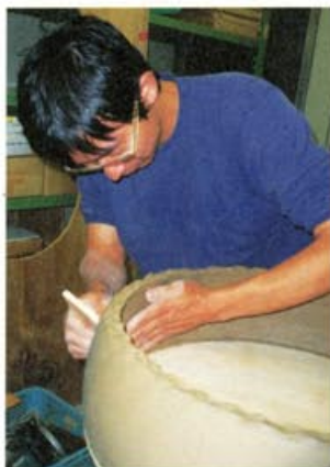
「ヨリコづくり」とは、1000年前から甕（かめ）や壺を作った手法で、棒状にした粘土を「よる」ように積み上げていく。