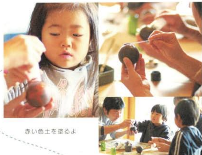
赤い色土を塗るよ