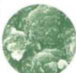
光っていない表面(8000倍)