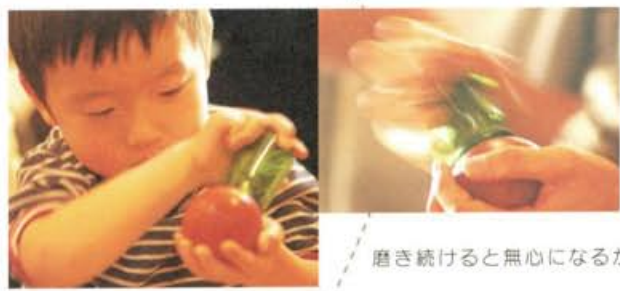
磨き続けると無心になるから不思議