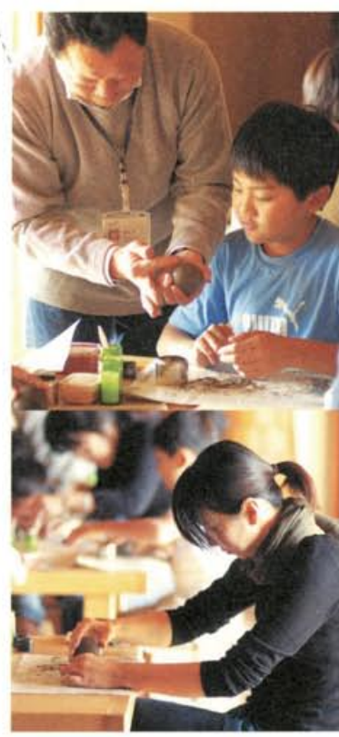
きれいな形を作るには姿勢も美しくないとね