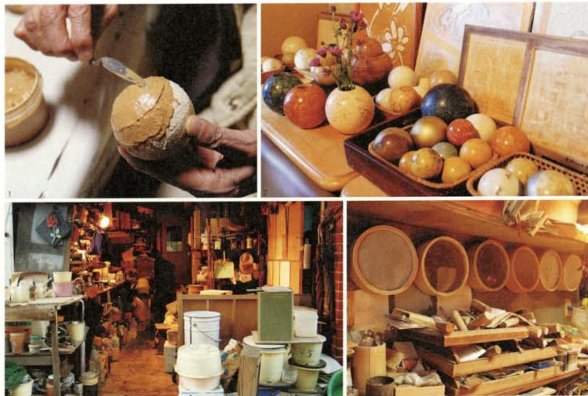
1. どろだんごに色土を塗り磨く。その方法も、試行錯誤の末にフィルムケースへと進化した。 2. 日本各地の土で作られた榎本さんのどろだんご。 3, 4. 「来るものは拒まず」の工房。榎本さんはその知識と技を気さくに教える。

粘土と砂と藁スサで芯を作り、乾かしては整え、乾かしては整える。いかにきれいな球形を作るかがどろだんごの命だ。いくつかの工程を経て、仕上げに全国から集まってきた色土を選び、生石灰クリームを混ぜて薄く塗り重ね磨いていく。生石灰クリームは、「現代の大津磨き」で編み出した榎本さんの知恵。磨きにさらなる輝きをもたらすものだ。まさに、