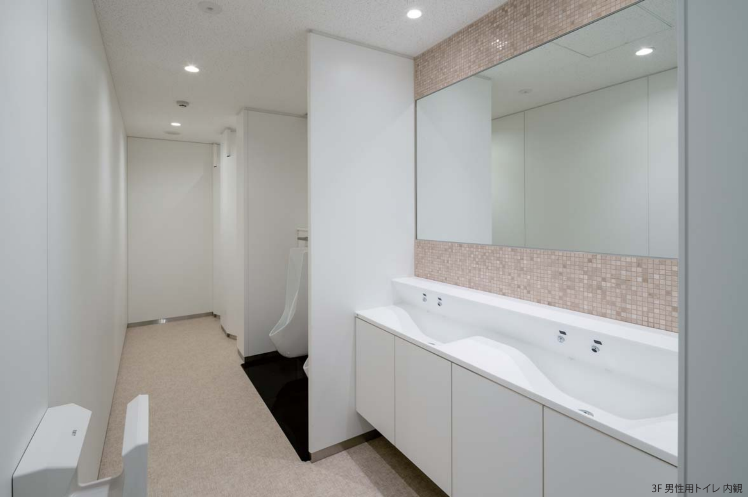
3F 男性用トイレ 内観