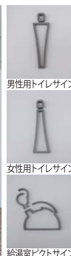
男性用トイレサイン