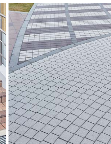
舗装面の交差部分