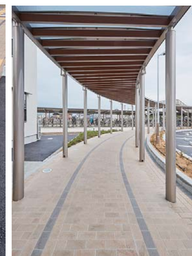
JR三本松駅からのシェルター