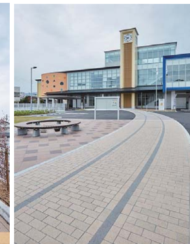
広場からのアクセス