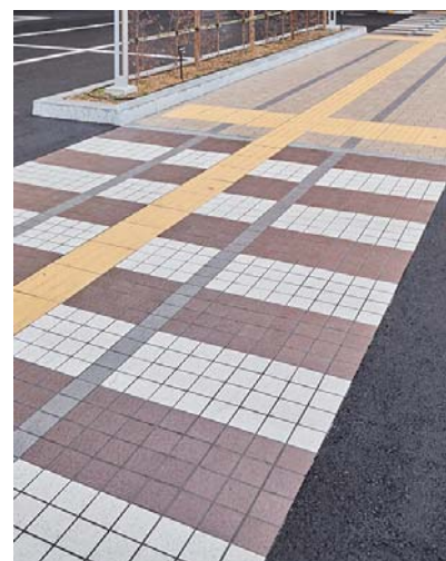
南側出入口へのアクセス