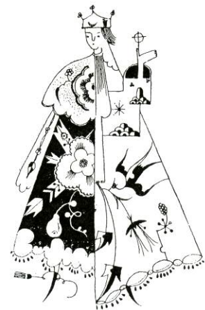
森谷によるイラスト (『これからの室内装飾』より)

大正時代に活躍した家具デザイナー・ もりやのぶお 森谷延雄(1893-1927)を紹介します。森谷は、33年という短い人生のうちで、研究、家具デザイン、執筆、教育など驚くほど膨大な仕事を家具界発展のために成し遂げました。本展では、その中でも、彼の理想と資質が最も顕著に表れたデザインに焦点をあてて森谷独自の表現の世界をご覧ください。