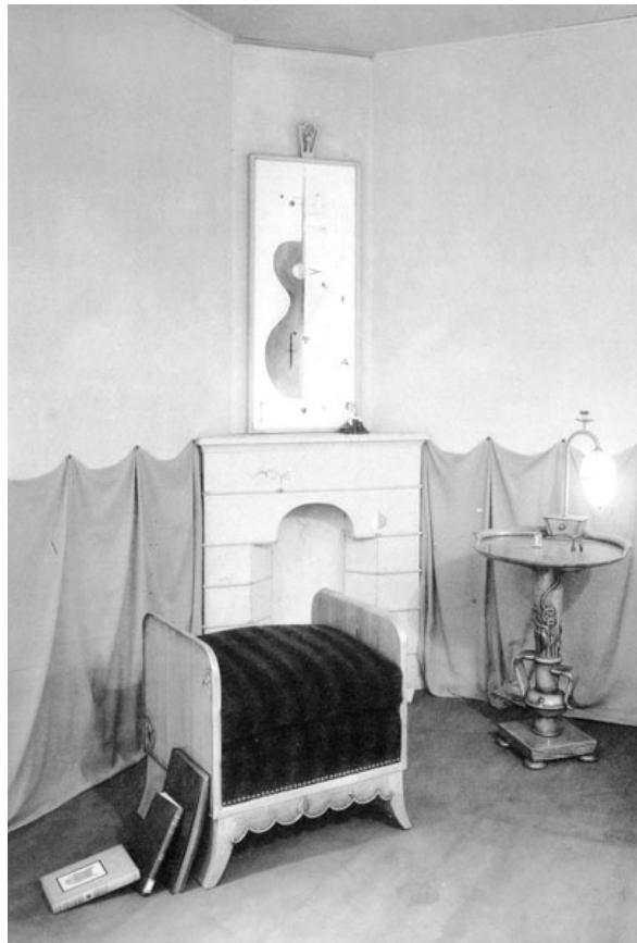
写真1：『小さき室内美術』より「ねむり姫の寝室」（1926、個人蔵） 森谷は、この部屋をグリム童話の『ねむり姫』から想を得てつくったという。お伽話の世界そのままに、甘いメルヘンムードを醸し出している。

FURNITURE OF FANTASY - THE WORLD OF NOBUO MORIYA -